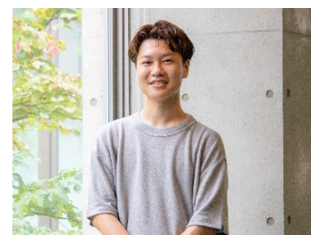
PDP4期生 都立日比谷高等学校出身 内定先：楽天グループ

就職活動はロンドン大学の試験の時期と重なっており、最も大変だったことの1つです。不安になることもありましたが、面接で PDP の話をするに興味をもってもらえることが多く、自信を持って就職活動に臨むことができました。苦手だった英語も TOEIC のスコアを入学時から 200 点以上伸ばし、第一志望の就職先に内定をいただきました。武蔵大学とロンドン大学、2つの大学の学位を取得したことはもちろんですが、なによりも4年間 PDP をやりとげ、英語に対する苦手意識を払拭できたことが大きな自信になっています。今後はさらに英語力を磨き、将来は海外の事業にも携わりたいと考えています。