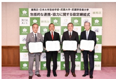
▲4者による協定締結の様子