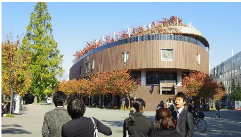
コラボレーションコモンズはこの施設の 1F

一方で、コラボレーションという教育設計が根幹にあるため、それぞれの活動がお互いに見えるような配置が工夫されている。ゼミにおける発表練習などを想定して、ロールスクリーンやパーティションが使い勝手よくあるが、完全に個室化しないような設計になっている。今後計画されている図書館のラーニング・コモンズの改築と併せて、自由学習空間の目的に応じた使い分けがより明確になり、学生の主体性を刺激する仕掛けがさらに充実していくようである。