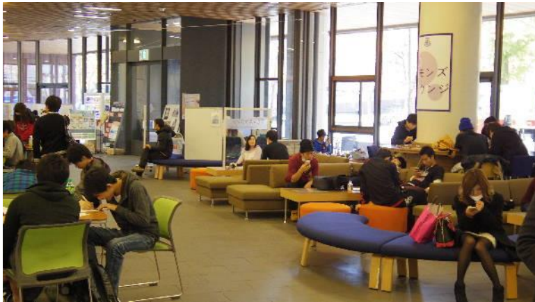
ラウンジのソファは人気で、勉強だけでなく“大学での居場所”も上手に提供している