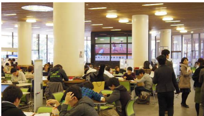
580 席、7 の目的別エリアがあり、座席のそばには必ずホワイトボードが設置されている